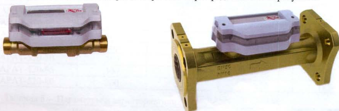
Рисунок 1 – Внешний вид расходомеров

Внешний вид расходомеров – счётчиков жидкости ультразвуковых КАРАТ-520 представлен на рисунке 1. Места пломбирования расходомера представлены на рисунке 2.