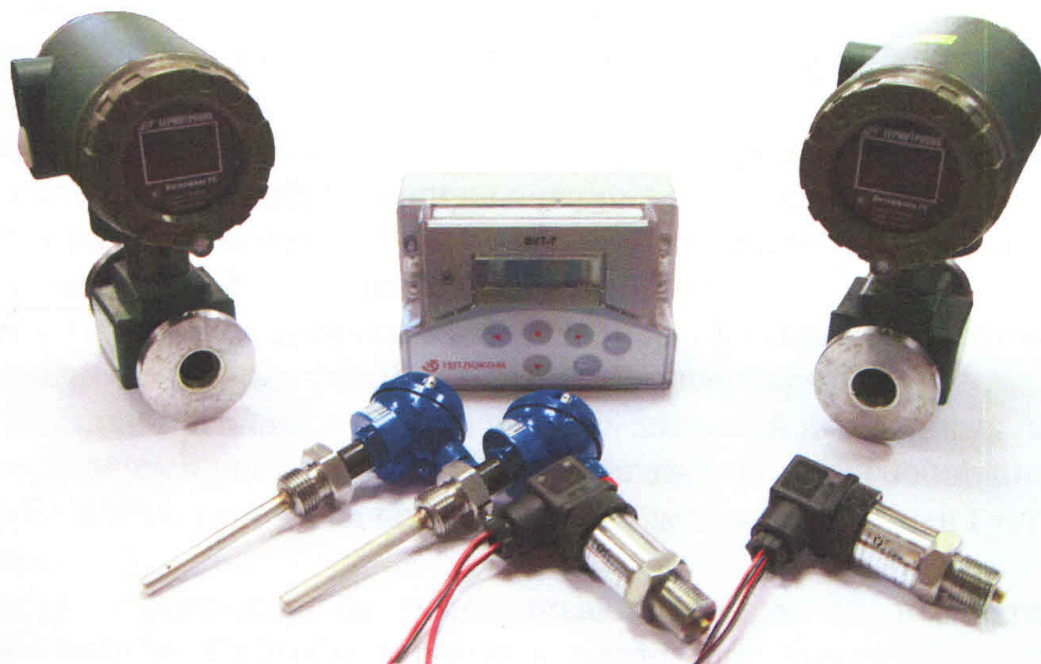
Рисунок 1 – Внешний вид теплосчетчика

Внешний вид теплосчетчика приведен на рисунке 1.